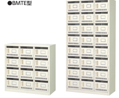
③ BMTE-12 (N)